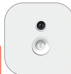
Système de détection combinant un capteur infrarouge (mouvement) et un capteur de luminosité