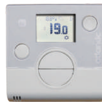
Télécommande d'ambiance simplifiée

(1) Selon modèle. (2) VS un système de PAC air-air gainable sans régulation pièce par pièce - source Étude Atlantic CRCT.