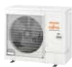
AOYG 30 et 36 KBTB monophasé