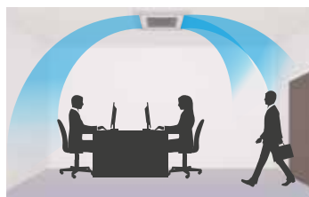
Diffusion d'air confortable en évitant le soufflage direct sur l'occupant.

L'orientation de chaque volet peut être réglée de façon indépendante via la télécommande filaire, permettant ainsi d'éviter les courants d'air et d'ajuster la diffusion à la configuration de la pièce.