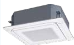
AUXG 30 et 36 KRLB