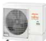
AOYG 36 KRTA triphase