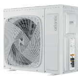
1U 036 DB