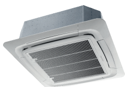
AB 036 DB