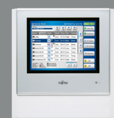
Télécommande centralisée IP