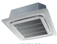
AB 024 DB