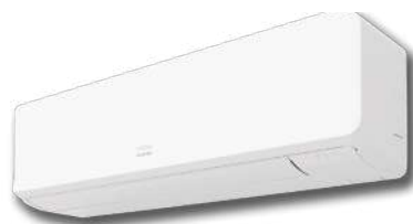
Tailles 18 à 24