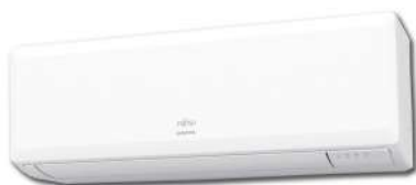
Tailles 7 à 12