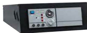
Quadro di comando base NAVISTEM B1000