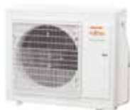
AOYG 24 KBTB