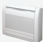
AGYG 9 à 14 KVCA