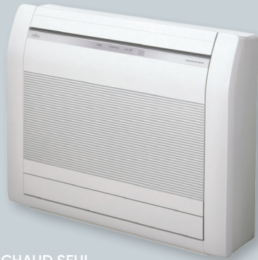
VERSION CHAUD SEUL SELON MODÈLE