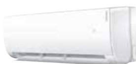
AS 005 à 018 NB