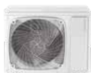
SU 036 NB.UE