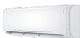
AS 007 à 018 DB