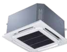
AB 009 à 018 DB