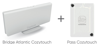
Bridge Atlantic Cozytouch