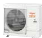
AOYG 30 KBTB