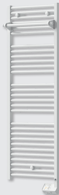
Corsaire 2 électrique

En acier avec tubes ronds Ø22mm et collecteurs carrés