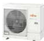
AOYG 36 KATA